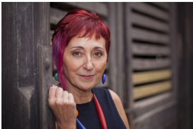
Copy- Pau Sanclemente.

Elia Barceló (Elda, Alicante, 1957) es una autora con varios best sellers internacionales en su haber. El secreto del orfebre ha sido traducido a once idiomas. El vuelo del Hipogrifo , Disfraces terribles y Las largas sombras – también éxitos en el extranjero- combinan elementos de la novela de misterio y del género negro con historias realistas. Esta mezcla de géneros, combinada con un exquisito trabajo de ambientación histórica y creación de personajes, es su marca de fábrica.